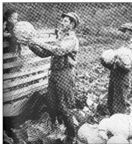
La récolte des choux – Tirée de C'était l'automne, La vue rurale traditionnelle dans la vallée du Saint-Laurent, Jean-Provencher, Boréal Express, 1980, p. 89.

son devait être préparée pour l'hiver. Il fallait mettre les châssis